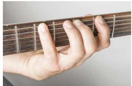
3 doigts posés