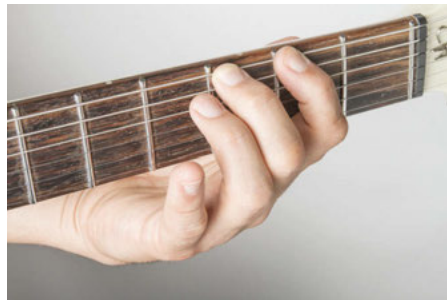
2 doigts posés

On corse l'affaire: essayez maintenant de jouer le riff avec trois doigts (index, majeur, auriculaire, soit les doigts 1, 2 et 4) en les laissant posés à chaque fois que c'est possible, de manière à placer votre main.