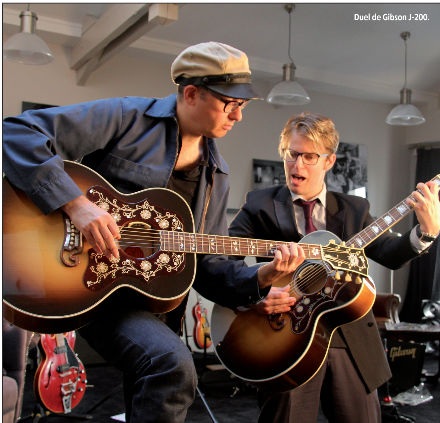
Duel de Gibson J-200.