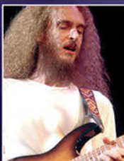
GUTHRIE GOVAN The Aristocats etc.

The flexibility of the Axe-Fx II is supreme. I did extensive tone testing and found it to be flawless... It's exceptional and I'm grateful.