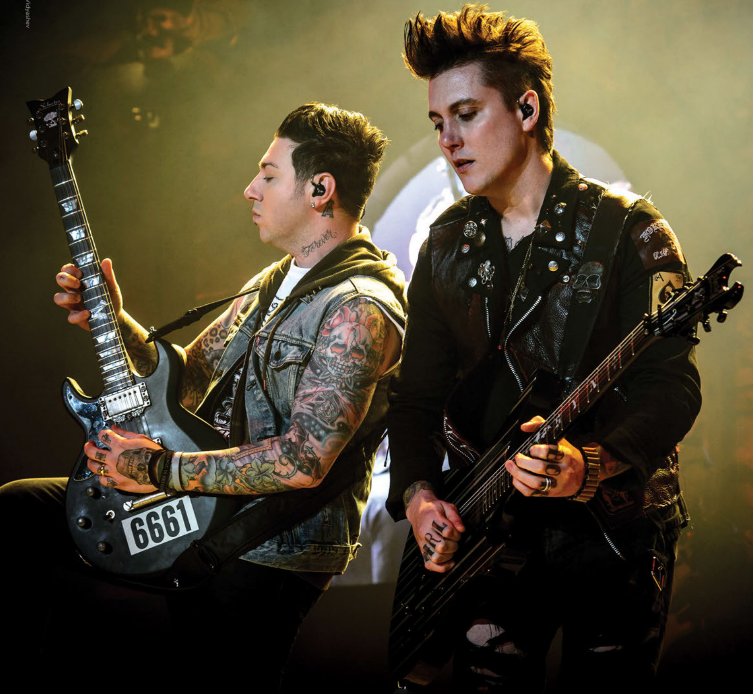
Zacky joue sur Skinny Top Heavy Bottoms 10-52 Synyster joue sur Slinky M-Steel Skinny Tops 10-52