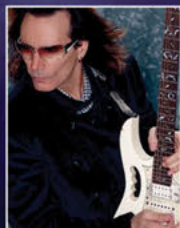
STEVE VAI Solo Artist

The flexibility of the Axe-Fx II is supreme. I did extensive tone testing and found it to be flawless... It's exceptional and I'm grateful.