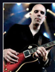
BILLY HOWERDEL A Perfect Circle, Ashes Divide

The tone is simply amazing, and that is coming from a self-admitted amp junkie. This thing delivers amps, cabs, effects, and total control!