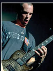
MARK TREMONTI Creed, Alterbridge

I've tried every modeler on this planet and Fractal is miles ahead in every area. It's also flawlessly dependable on stage and in the studio.