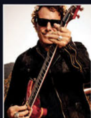
NEAL SCHON Journey, Solo Artist

Unbelievable on every level! The flexibility is so great that every player on earth could have one and I'd still be able to have my own unique tone.