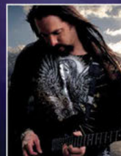
JOHN PETRUCCI Dream Theater

The sound and feel of this magic box are so 'real' that witchcraft would appear to be the only logical explanation. Most pleasing!