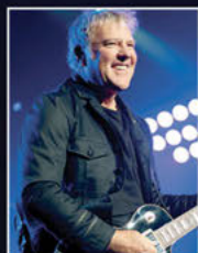
ALEX LIFESON Rush

The Axe-Fx II has completely changed the way I think about guitar processing. It does an incredible number of things astonishingly well.