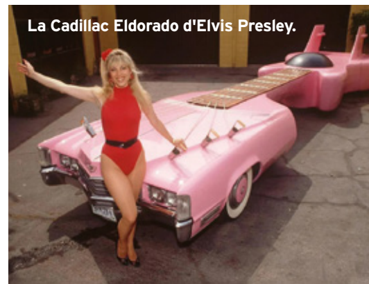
La Cadillac Eldorado d'Elvis Presley.